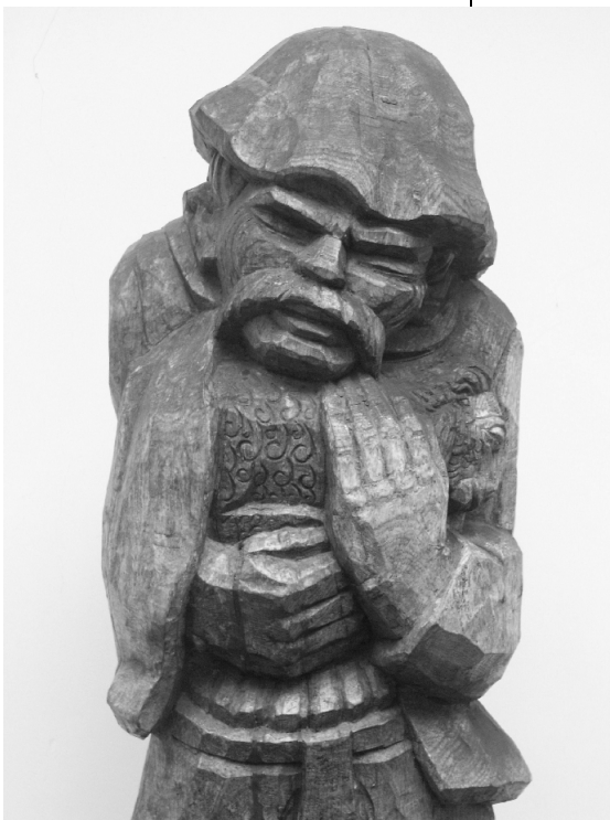
Egy Szervátiusz szobor