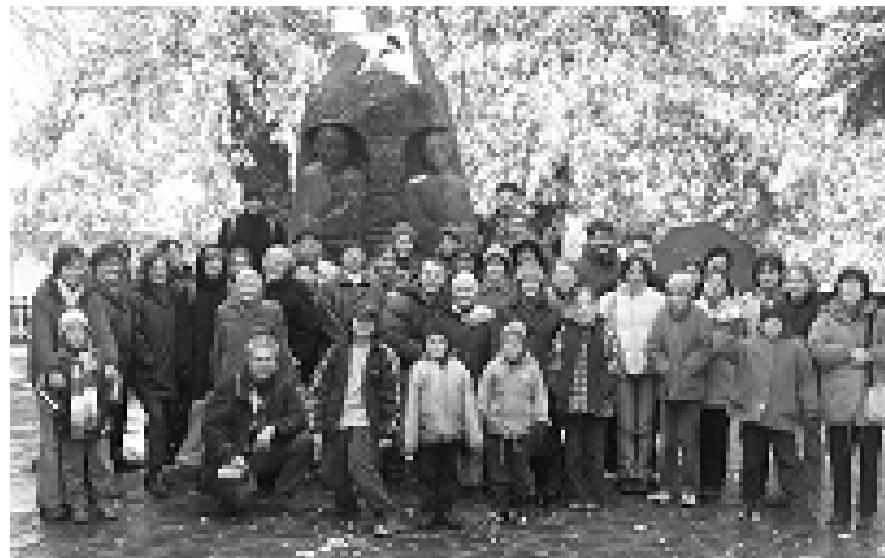
Farkaslakán a Tamási Áron szobor előtt